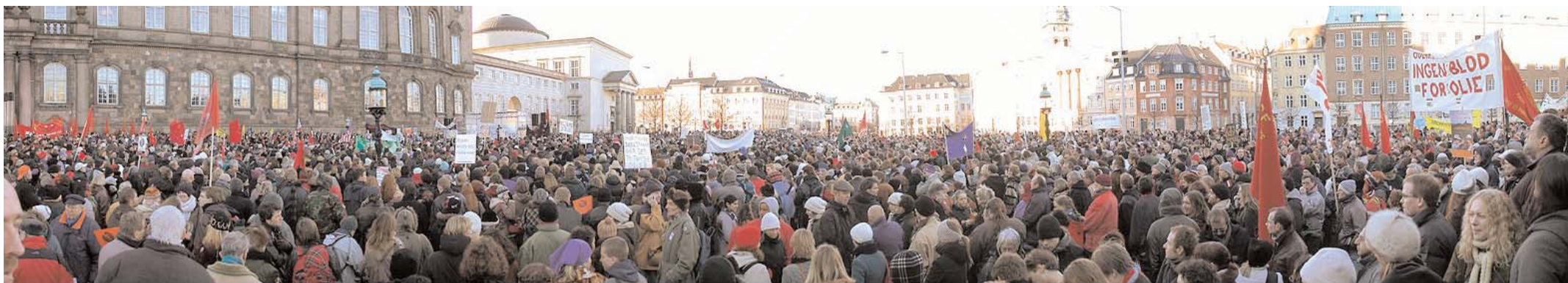
København mod Krig, 15. Februar 2003. I dag (aug. 05) mener et flertal af befolkningen, 45,7 procent, at det var forkert af Danmark at gå i krig mod Irak.

Masser af muligheder for sport, medieværksteder, megafester og små hjørner at mødes på.